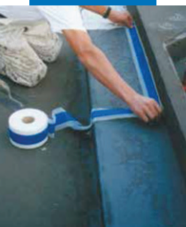
Пример гидроизоляции угла между нижней и боковой частью ванны с помощью Mapeband

Mapelastic AquaDefence и разгладьте с помощью гладкого шпателя.