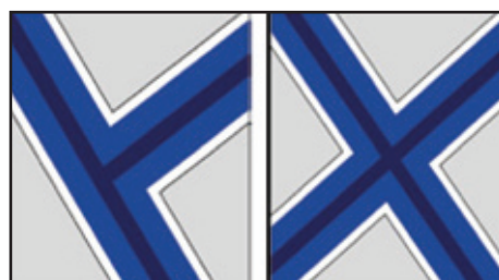
Установка T-образных профилей