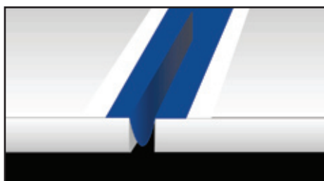
Расположение Mapeband в форме буквы Ω в деформационном шве