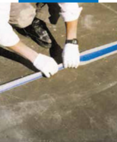
Пример гидроизоляции деформационного шва на террасе