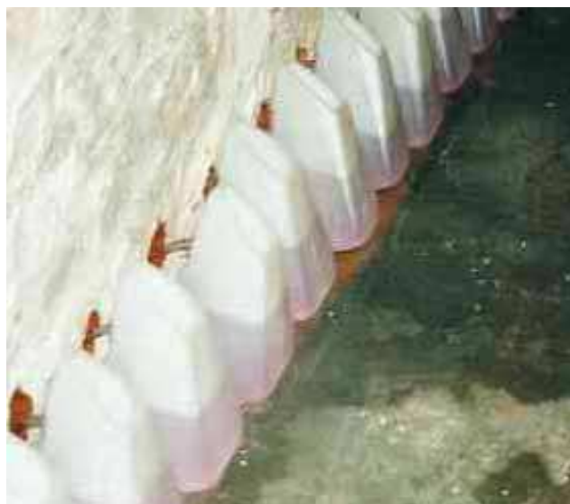
Рисунок 1: Материал PCI Bohrlochsperre в течение не менее 24 часов проникает в кладку из накопительных ёмкостей.